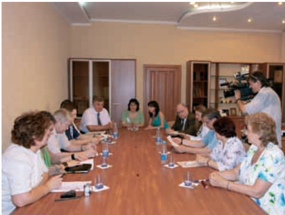
Круглый стол семинара по универсальному дизайну среды

Что такое «универсальный дизайн» в представлении разработчика одноименного модульного курса, профессора Лори Рингерта? Это — дизайн среды, средств коммуникации, продуктов и услуг, способствующий их применению всеми людьми независимо от их возраста, размера тела или возможностей.