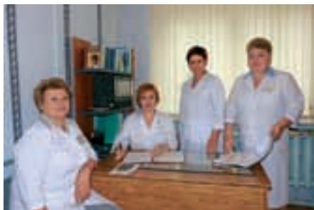
Совет медицинских сестёр