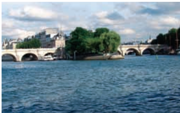
А это — Париж. Чем живописная речка Усть-Шиш хуже Сены?