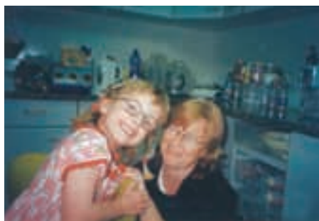
Эти омские дети нашли свой дом за рубежом