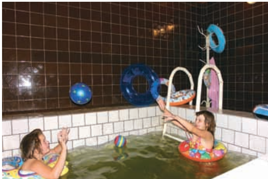
Главный центр притяжения детей, посещающих дневной стационар, — бассейн и сауна