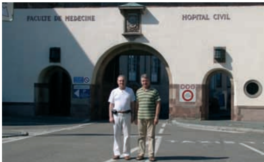
У входа в госпиталь Страсбургского университета