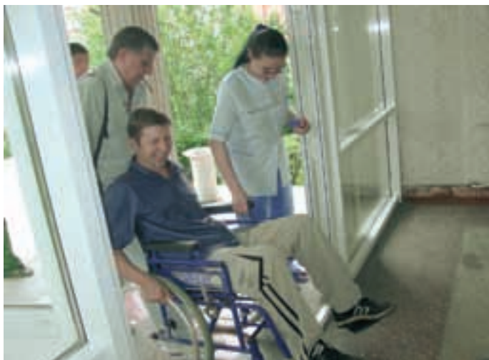
Практические занятия участников семинара