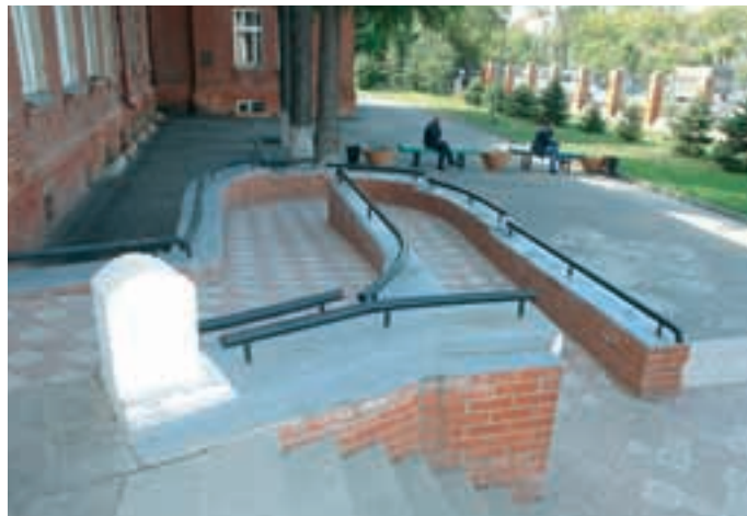
Универсальный дизайн позволяет беспрепятственно передвигаться любому человеку независимо от его возможностей

И ещё одна мировая тенденция говорит в пользу развития универсального дизайна. В цивилизованных странах наблюдается старение населения, однако пожилые люди имеют достаточно крепкое здоровье и стремятся путешествовать. Поэтому во многих городах, являющихся центрами туризма, в последние годы активно занимаются обустройством не только мест отдыха путешественников, но и пешеходных маршрутов, магазинов, кафе, ресторанов. Чтобы всюду были приспособления, облегчающие передвижение пожилых туристов, предоставляющие возможность кратковременного отдыха. Таким образом, правительства этих стран делают свои города ещё более привлекательными для пожилых туристов, которые составляют солидную часть путешествующих.