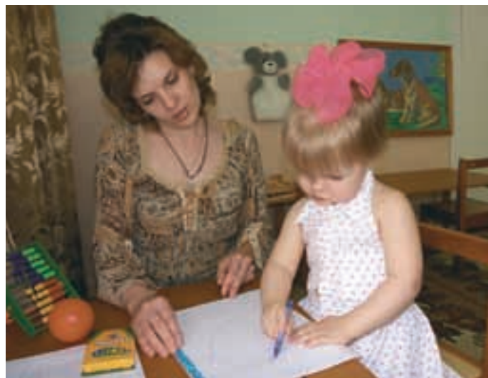
Эти малыши из омских домов ребёнка надеются встретить своих мам и пап...