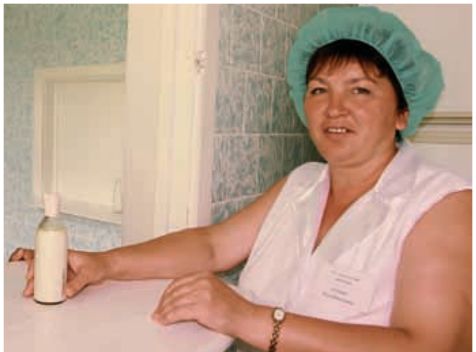
Маленькие горьковчане с удовольствием едят продукты молочной кухни

— Мы намеренно расширяем сеть социальных, медицинских учреждений. К примеру, открываем ФАПы даже там, где их не было. А если появляется возможность, то и участковые больницы с небольшими стационарами, чтобы можно было на месте оказать серьёзную первичную медицинскую помощь деревенским жителям. Проводить такую политику в жизнь в то время, когда сверху диктуют необходимость оптимизации сети госучреждений, сокращения неэффективных, затратных, конечно, непросто. Но если мы не будем идти в направлении сохранения в каждом населённом пункте того или иного медучреждения, то породим большую беду. Я выше говорил о нехорошей тенденции переселения риэлторами на жительство в села асоциальных семей из города. Кроме детей-беспризорников, эти семьи ещё одну проблему с собой привозят — ту-