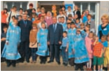
Фото с обложки