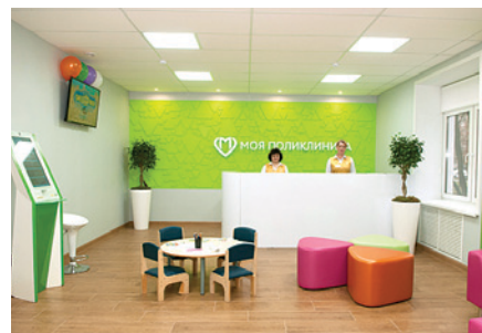
Новый дизайн помещения Филиала № 1 ГБУЗ «ДГП № 23 ДЗМ»

— Да, вы правы. Амбулаторный центр с филиалами — это не только здания, состоящие из которых требует постоянного внимания, это большие коллективы медработников, каждый из которых имеет свои особенности. Тем не менее я могу уверенно сказать, что существуют универсальные принципы управления, которые помогают мне эффективно держать руку на пульсе этого непростого хозяйства и смотреть вперёд с оптимизмом. Во-первых, никогда не стоит останавливаться на достигнутом. Результат всё время нужно улучшать — это глав-