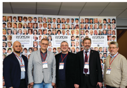
Международный конгресс и научно-практическая школа «Актуальные вопросы судебной медицины и экспертной практики» г. Москва (2013)